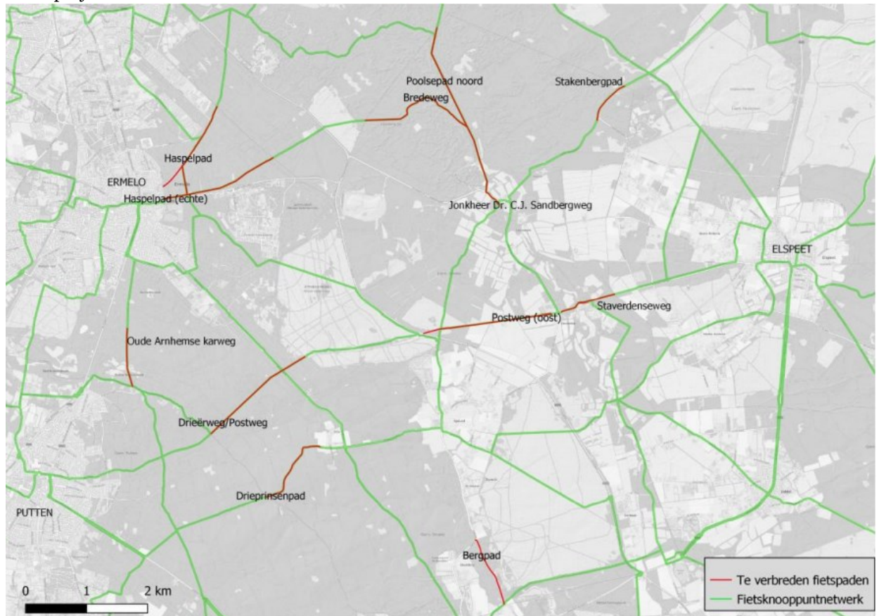
Figuur 1 Te verbreden en vernieuwen fietspaden binnen de gemeente Ermelo.