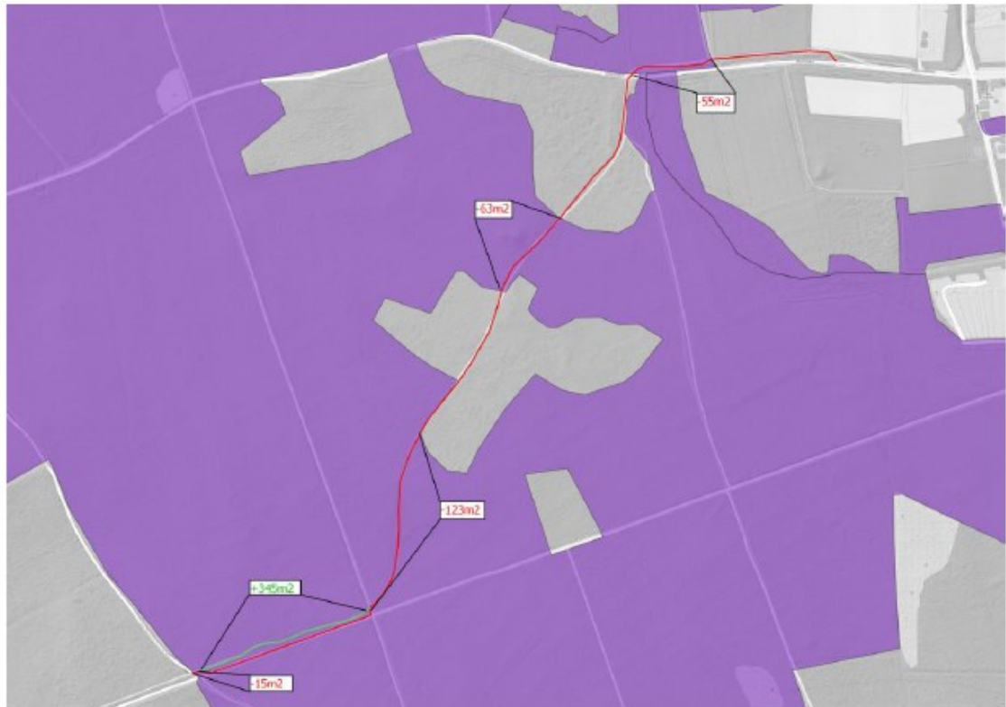
Figuur 4 Het te verbreden fietspad aan het Drieprinsenpad (rode lijn), het fietspadtracé dat wordt opgeheven (groene lijn) en de ligging van H9120 Beuken-eikenbos met hulst (paars).