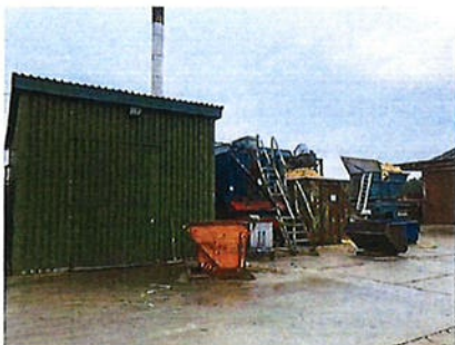
Boven: foto 5 perceel E 3054