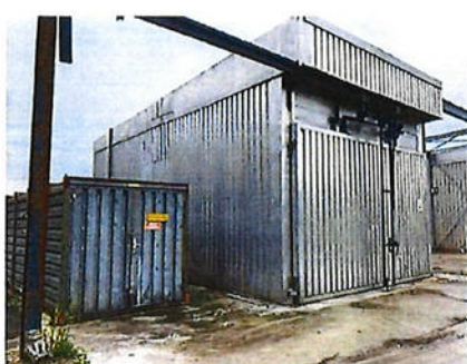
Boven: foto 3 perceel E 3054