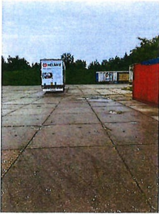
Boven: foto 7 perceel E 3054