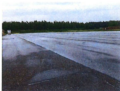
Boven: foto 2 percelen E 3389 en 3390