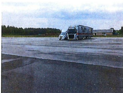
Boven: foto 1 percelen E 3389 en E 3390