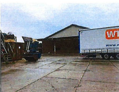
Boven: foto 6 perceel E 3054