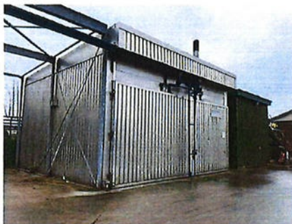
Boven: foto 4 perceel E 3054